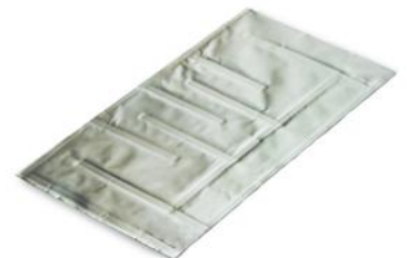
Intercambiador de calor Geyser™